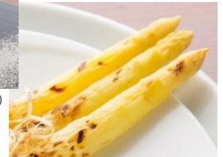
(ホワイトアスパラガスイメージ)