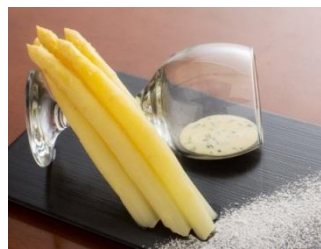
(ホワイトアスパラガスイメージ)