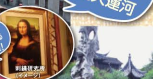
刺繍研究所 (イメージ)