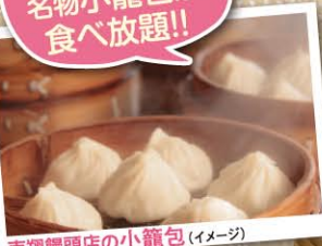
南翔饅頭店の小籠包 (イメージ)

昔ながら風情を残す「豫園商場」、異国情緒が漂う外灘(ワイタン)など、見どころは満載!!