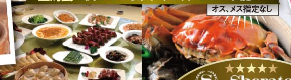
※料理写真はイメージです。実際の料理と異なる場合がございます

魚舟(ケツギヨ)を擲けて甘酢あんをかける料理! 見事な刀工で、リスのような形に!!