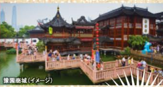
豫園商場 (イメージ)

昔ながら風情を残す「豫園商場」、異国情緒が漂う外灘(ワイタン)など、見どころは満載!!