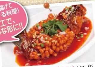
松鼠桂魚(ソングシュグイユウ) (イメージ)

魚舟(ケツギヨ)を擲けて甘酢あんをかける料理! 見事な刀工で、リスのような形に!!