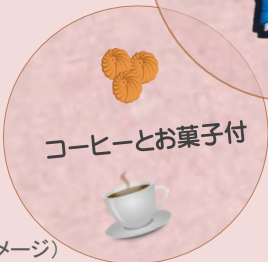
コーヒーとお菓子付