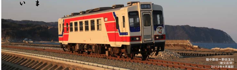
陸中野田～野田玉川 (被災区間) 2012年4月撮影