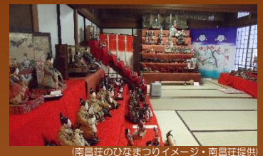
(南昌荘のひなまつりイメージ)

はるか昔から行われてきたひなの節句、我が子の幸せを願う家族の数だけ様々な雛人形が存在します。南昌荘では、そんな雛人形を一般有志から借り受けて展示、来場者楽しんでもらう催しを開いています。飾られる人形は江戸や明治、大正時代から受け継がれてきた古いものから手作りの雛人形まで、邸内の部屋毎に違う世界が広がります。