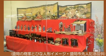
(盛岡の商家とひな人形イメージ)

盛岡市内の老舗商家からご寄贈いただいた貴重なひな人形や、その商家にまつわる史料、また江戸城大奥のひな祭りの様子などを描いた錦絵「千代田の大奥」などを展示しています。