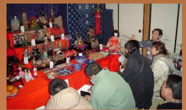
(遠野町家のひなまつりイメージ・遠野商工会提供)

つるしびな、郷土芸能(南部ばやし、松崎音頭、さんさ踊り、しし踊り)押絵、七宝まり、おひなさまの他、東日本大震災被災者、つるしびな教室受講者の作品も展示しています。