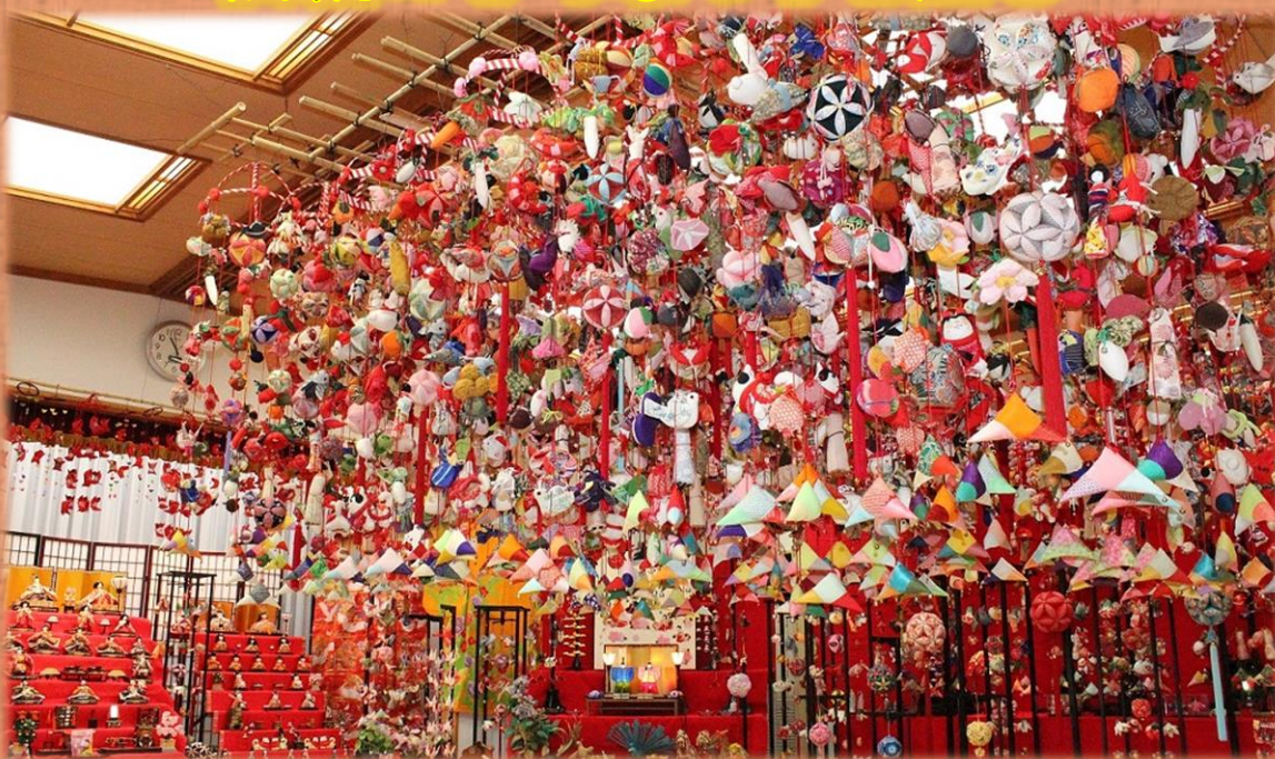
八日市つるし雛まつり(イメージ)

【出発日】 2月24日(土) ◆最少催行人員20名 ◆1名様より受付 ◆添乗員同行 【食事】 朝食 × 昼食 ○ 夕食 ×