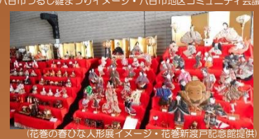
(花巻の春ひな人形展イメージ)

遠野は城下町であり、内陸と沿岸の交易の場所だったことから遠野の町家には、古くからの雛人形が数多く伝えられています。昔は、それぞれのお宅の雛人形を「見せておぐれんせ」と巡り歩いたものだと言われており、それを現代に復活させて手作りの雛めぐりマップ片手に家々に伝わる雛人形をご覧いただいています。期間限定の雛団子等その時期にしか手に入れないものや、知られていない遠野の町家の姿の発見ができます。