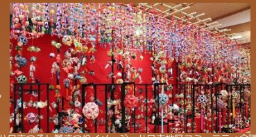
(八日市つるし雛まつりイメージ・八日市地区コミュニティ会議提供)

花巻市内の旧家で受け継がれてきた花巻人形の雛人形や芥子雛などが展示されています。