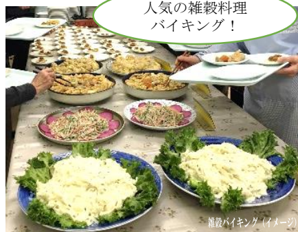
雑穀バイキング(イメージ)