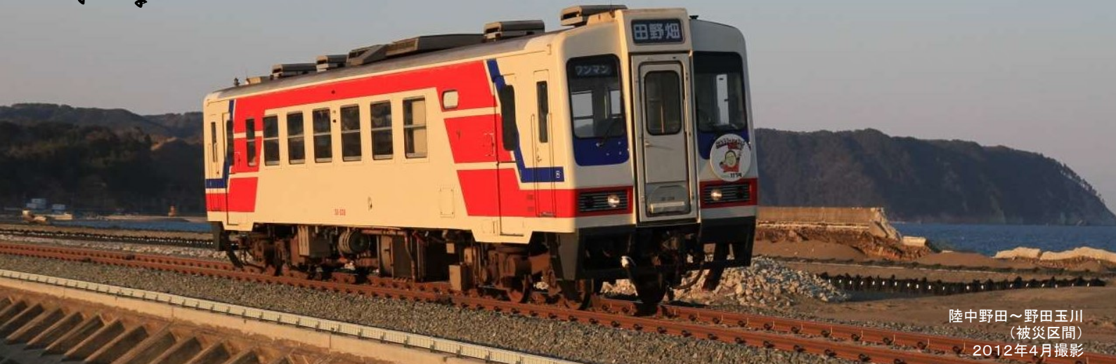
陸中野田～野田玉川 (被災区間) 2012年4月撮影

東日本大震災から9年。変わったもの。変わらないもの。 これからもずっと、語り継がれていくもの。