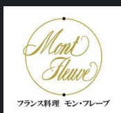
●NEW WING フレンチ