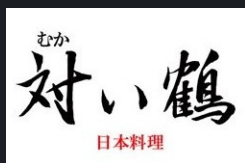
●NEW WING 和食