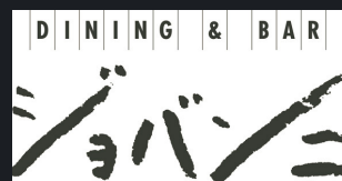
●NEW WING ランチbuffet