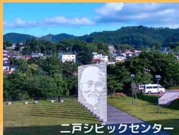
二戸シビックセンター