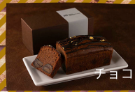
チョコレートマロンケーキ