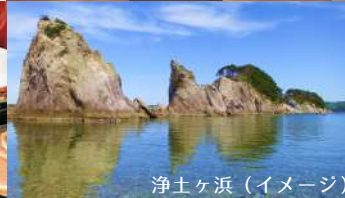
浄土ヶ浜 (イメージ)