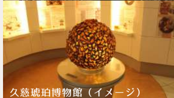
久慈琥珀博物館 (イメージ)