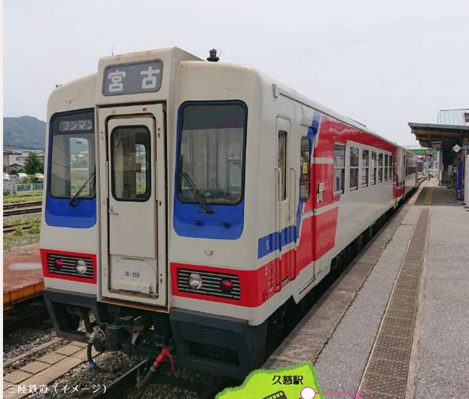
三陸鉄道 (イメージ)