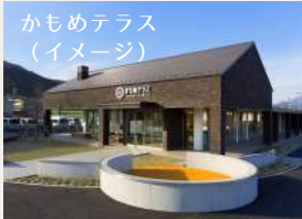
かもめテラス (イメージ)