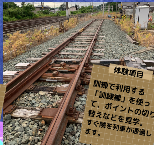
設備管理所「訓練線」