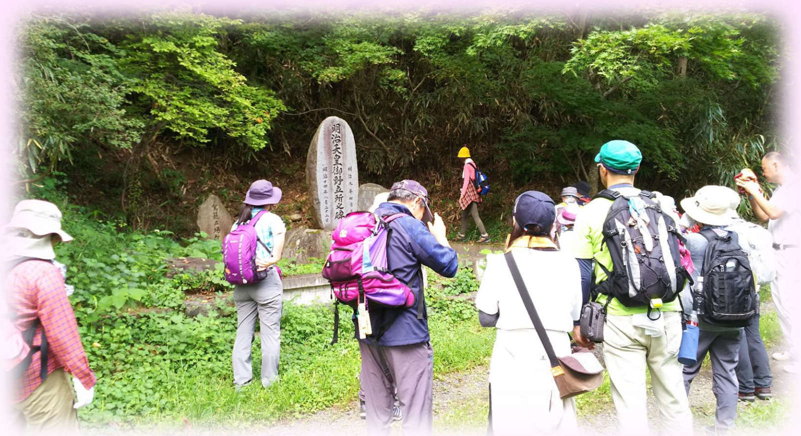
明治天皇御野点所之碑(イメージ)