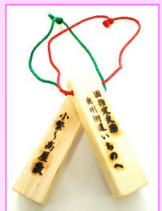
オリジナル通行手形(イメージ)

出発地「IGRいわて銀河鉄道」駅名入り「オリジナル通行手形」を参加者全員にプレゼント!!