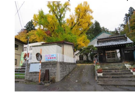
実相寺のイチョウ