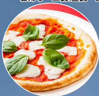
くずまき製チーズたっぷりピザ