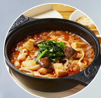
くずまき鍋・森のこだま館特製