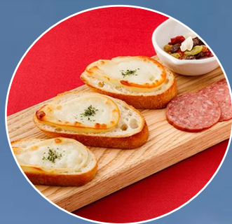
くずまき製の焼きカチョコバロ