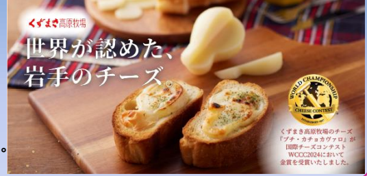
くずまき高原牧場 世界が認めた、 岩手のチーズ