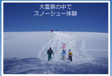
大雪原の中で スノーシュー体験