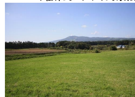
奥州街道標高最高地

コース 奥中山高原駅(スタート受付)⇒摺糠集落⇒明治天皇休憩地⇒奥州街道標高最高地点⇒旧中山一里塚⇒軽井沢プラザ⇒火行集落⇒ヨノ坂⇒小繋一里塚⇒小繋御番所跡⇒長楽寺⇒小繋駅(ゴール・16:00頃)