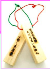
オリジナル通行手形(イメージ)

出発地「IGRいわて銀河鉄道」駅名入り「オリジナル通行手形」を参加者全員にプレゼント!!