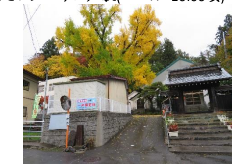
実相寺のイチョウ