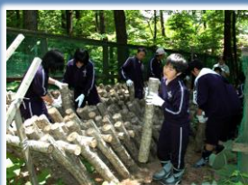
原木しいたけ収穫体験