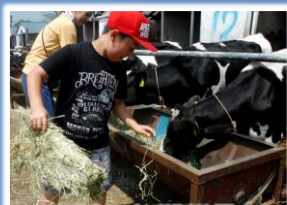
子牛のお世話体験

日帰り・二食(昼食・夕食)・冬のくずまきを満喫する自然体験と文化体験、そしてアクティビティー