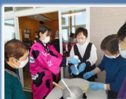
フレッシュチーズ作り体験